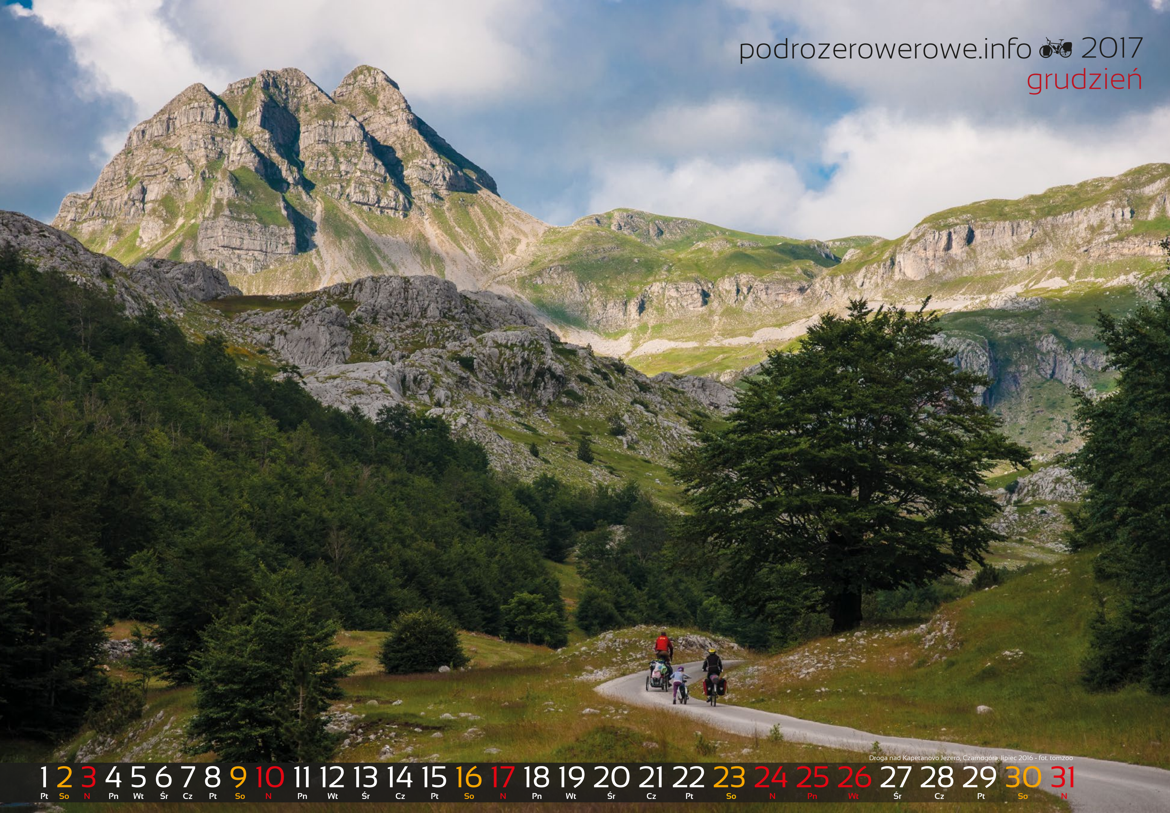
Droga nad Kapetanovo Jezero, Czarnogóra, lipiec 2016