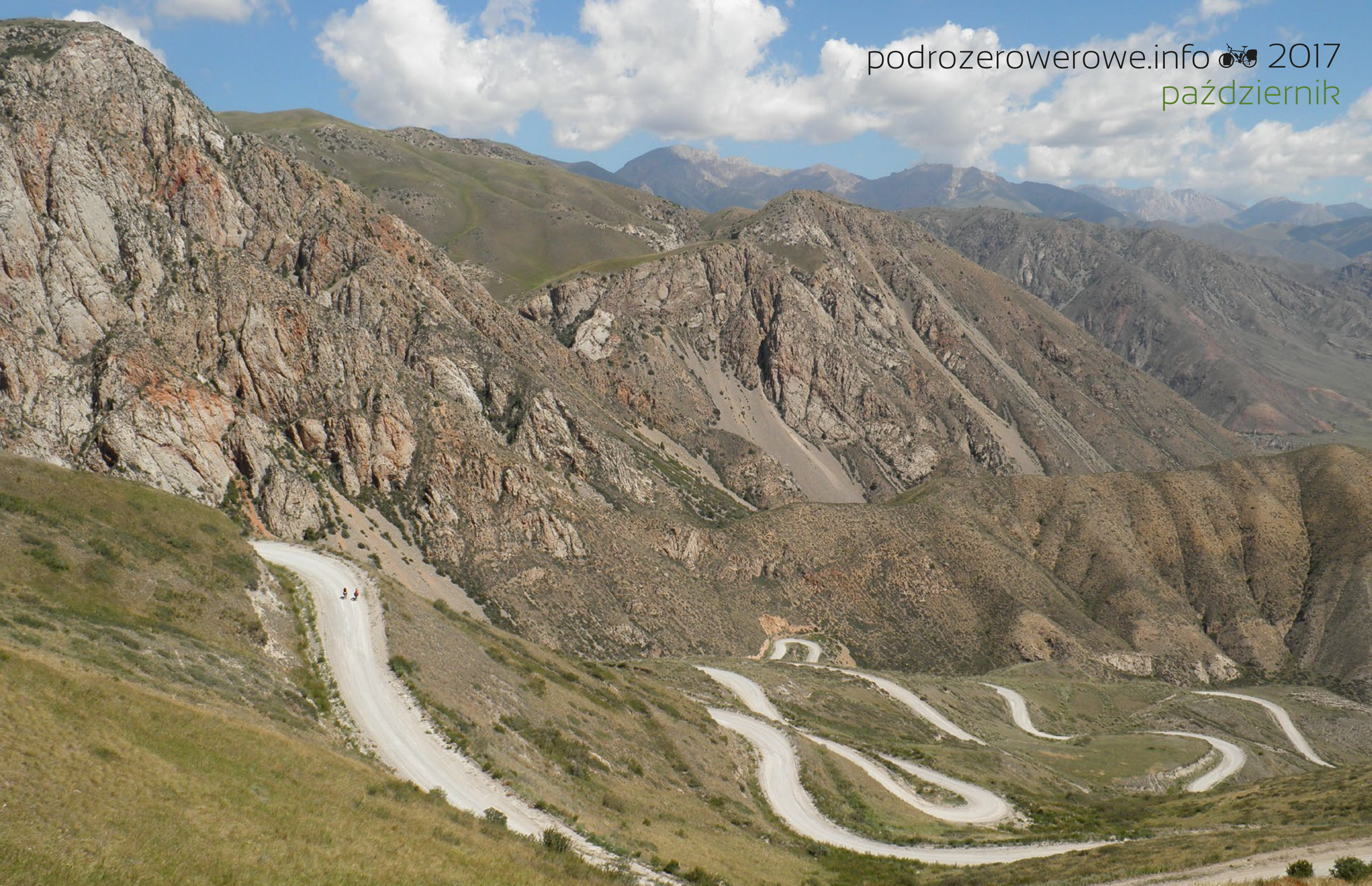
Kirgistan, kapitalny zjazd z przełęczy Kara-Koo, sierpień 2016