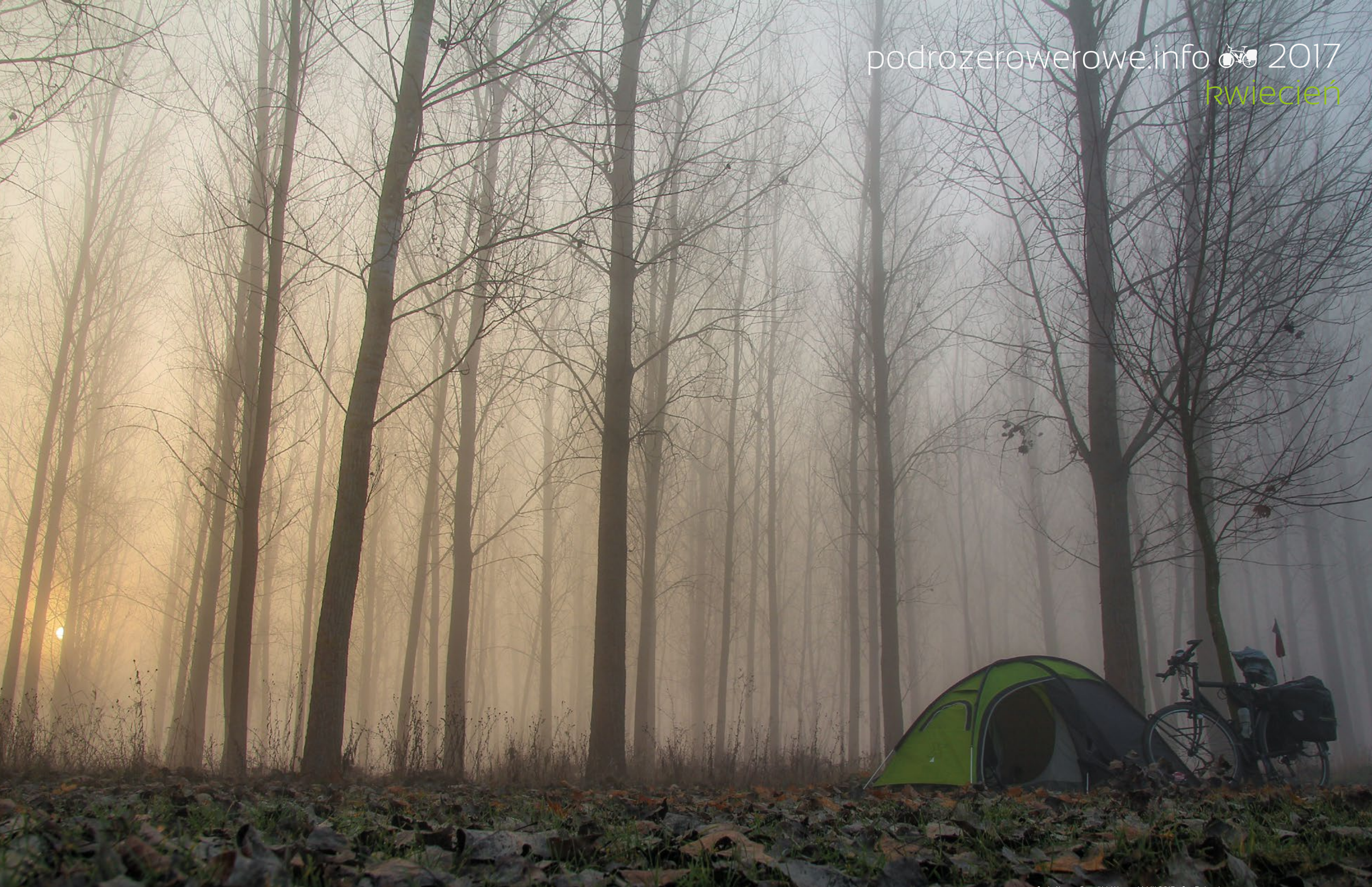
focipálya w Csegöld, Węgry, 16 XII 2015