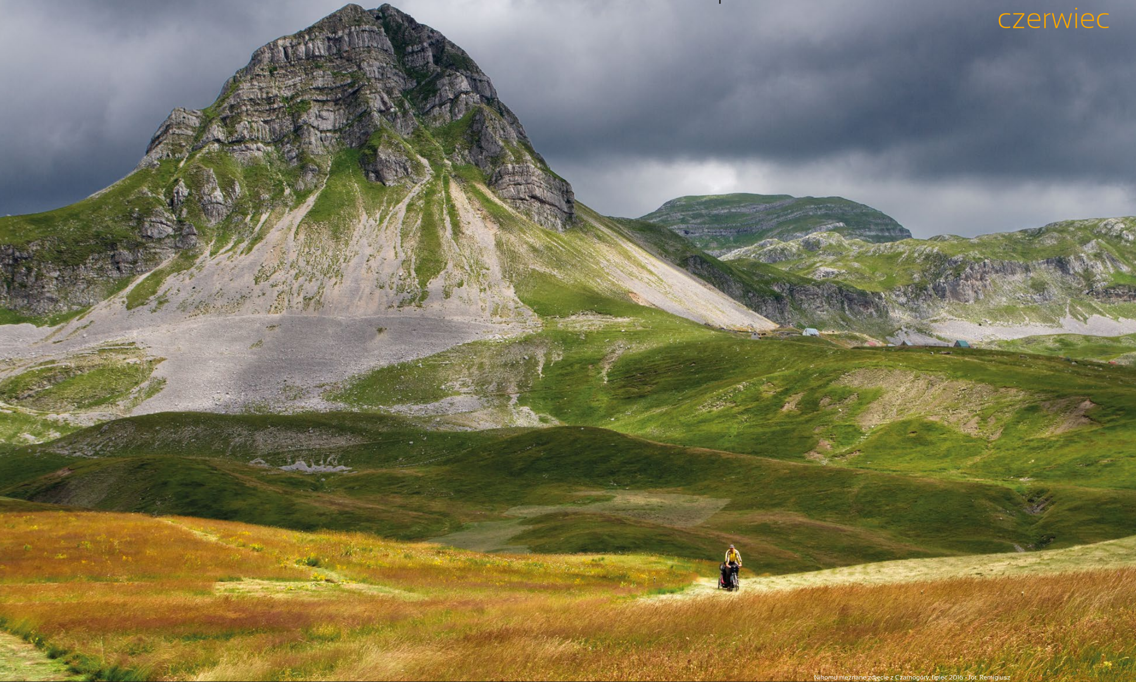
Nikomū nieznanē zdjęcie z Czarnógōry, lipiec 2016