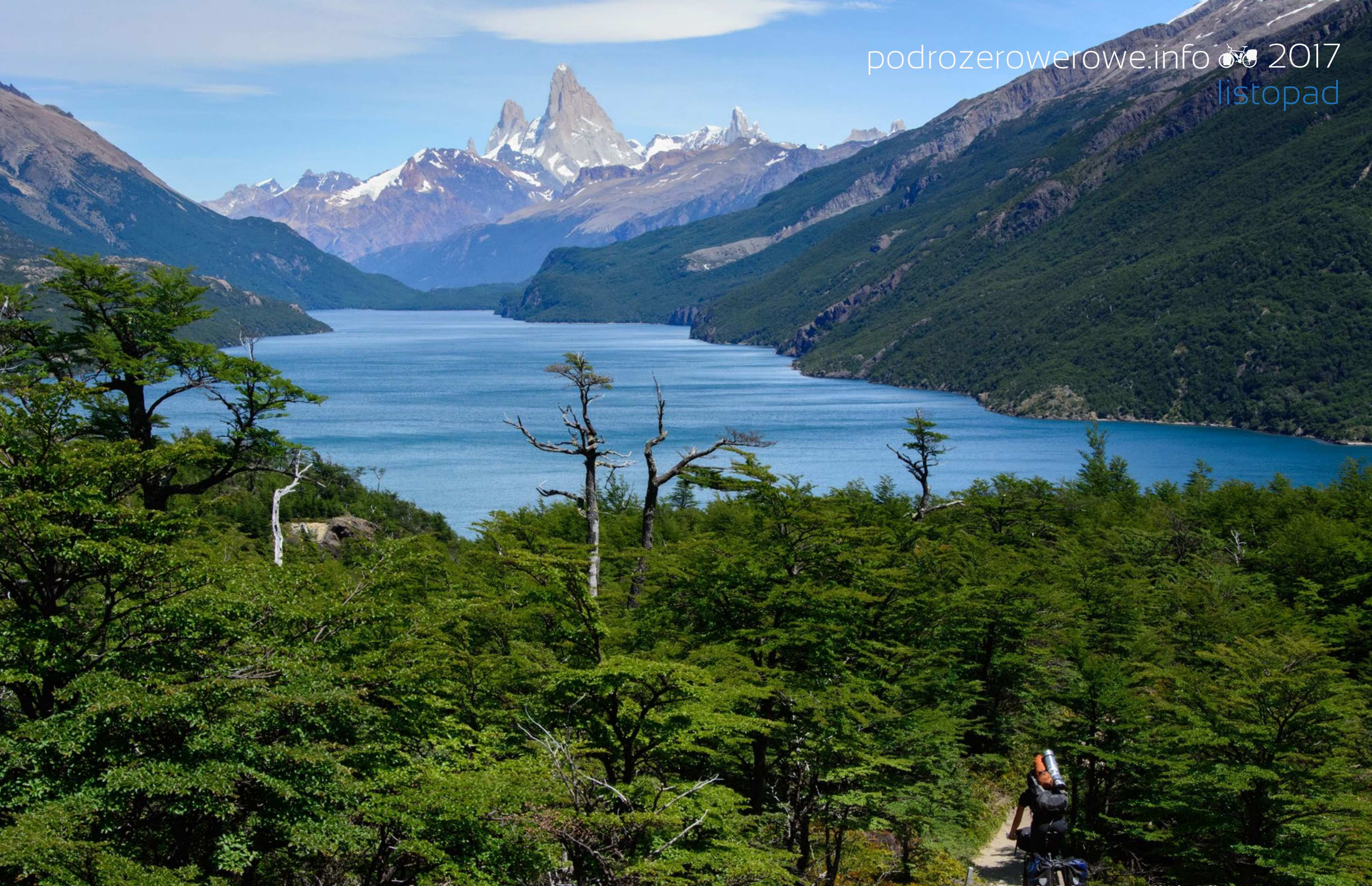
Lago del Desierto i Cerro Fitz Roy, Argentyna, styczeń 2016

1 2 3 4 5 6 7 8 9 10 11 12 13 14 15 16 17 18 19 20 21 22 23 24 25 26 27 28 29 30