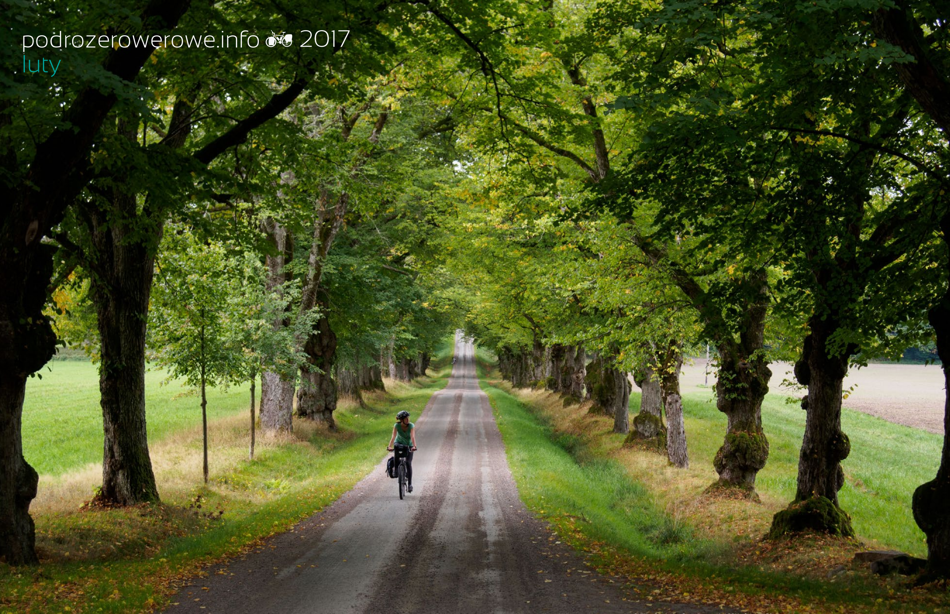
Okolice Goteborga, Szwecja, wrzesień 2016