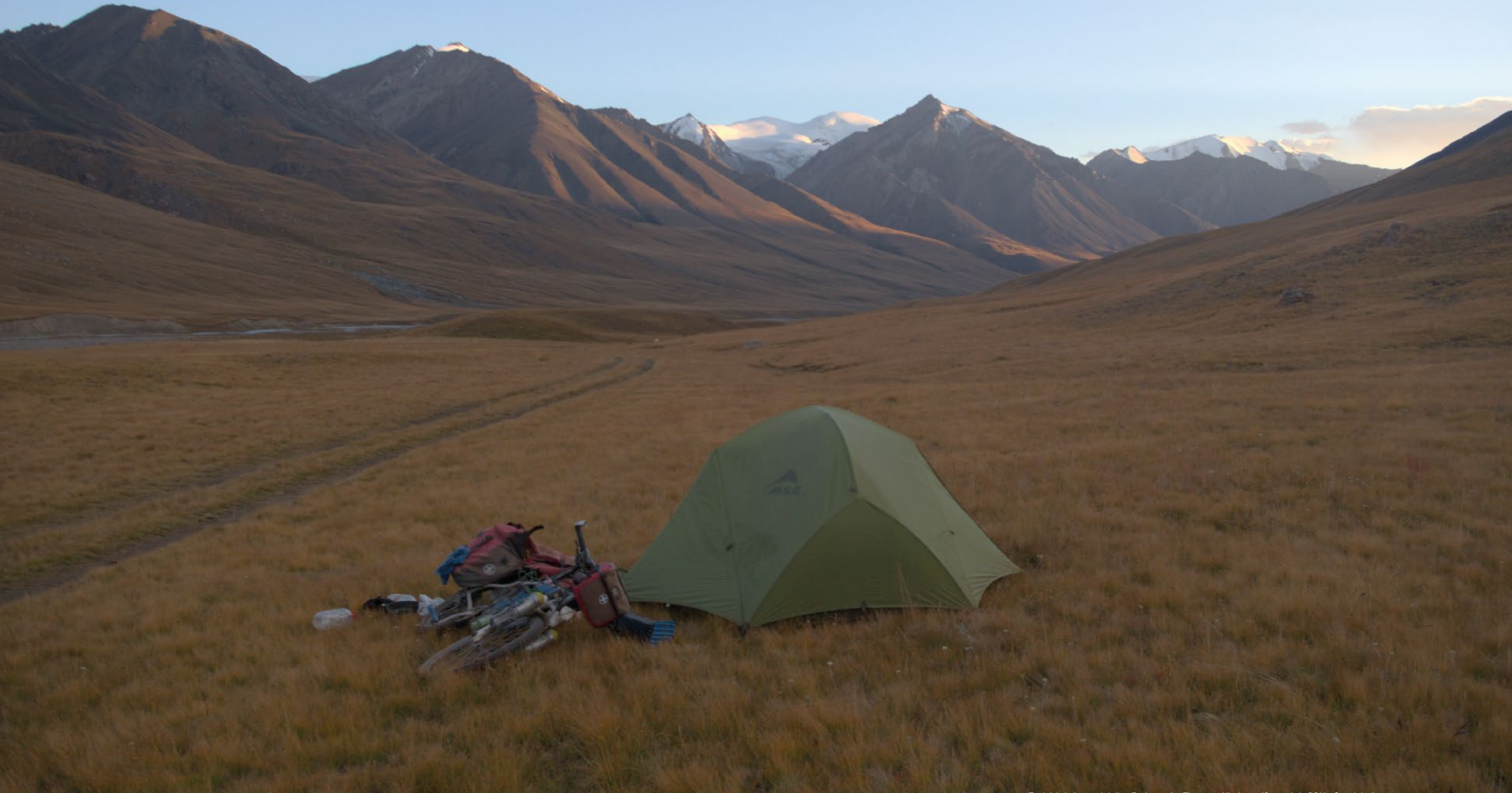
Zachód słońca nad doliną Burhan, góry Tienszan, Kirgistan, 12 września 2016