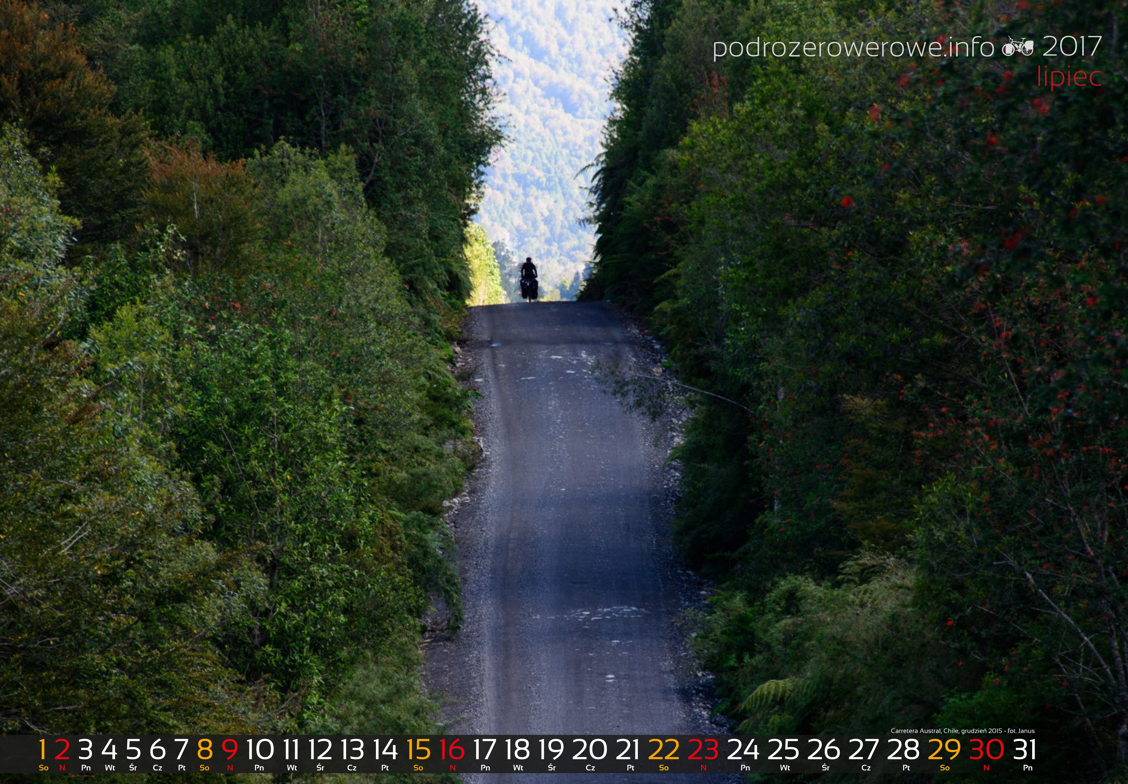
Carretera Austral, Chile, grudzień 2015