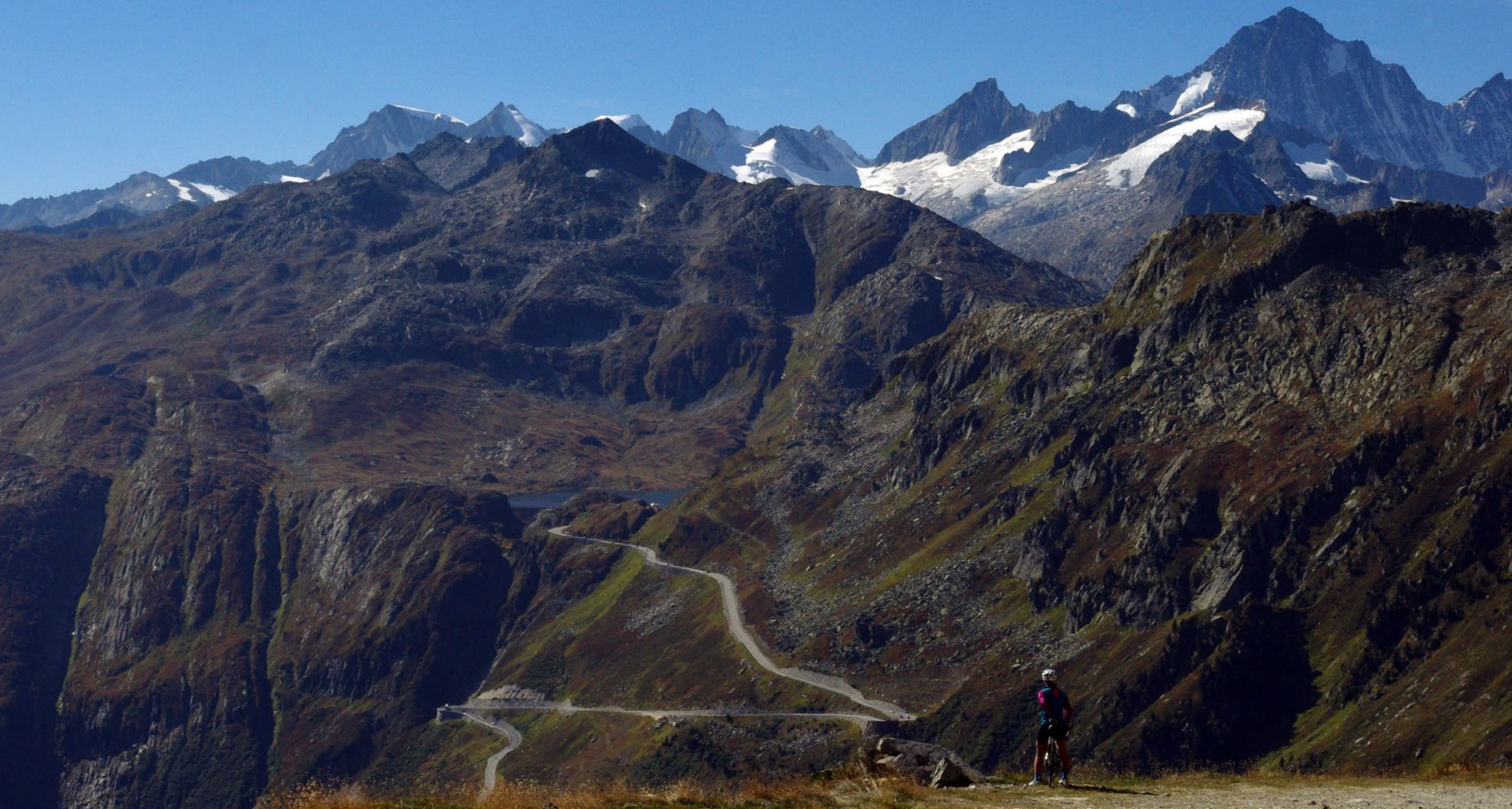
Zjazd z przełęczy Furka z widokiem na przełęcz Grimsel. Alpy Szwajcarskie. Wrzesień - fot. remi